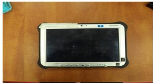
מידות טאבלט 20 X 28 X 2.5